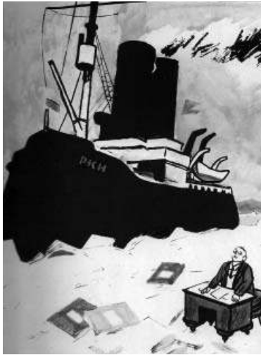
Пароход РКИ Рис. И.А. Малютина Плавали и такие в тогдашнем художественном пространстве.

Ильф И. Записные книжки. 1925 — 1937. М., 2000, с. 34,35,38. РКИ, если кто не знает, — «народный комиссариат Рабоче-крестьянской инспекции, Рабкрин, орган контроля и рационализации сов. учреждений и предприятий». (МСЭ, т. 7. Прямая — скулы. М., 1931, стлб. 358). Один из комиссариатов, на коих в те годы, в организационном плане, в стране все держалось.